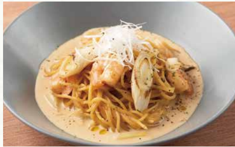
海老と葱の和風クリームパスタ