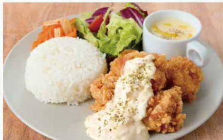
「TABLES」 チキン南蛮プレート