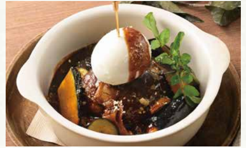
国産牛100%の 煮込みハンバーグ