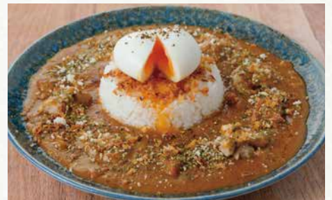
バターチキンカレー