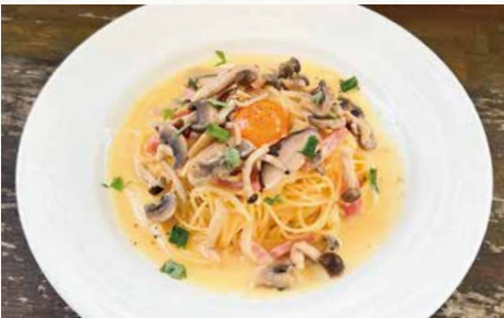
たっぷりきのこのペペたま