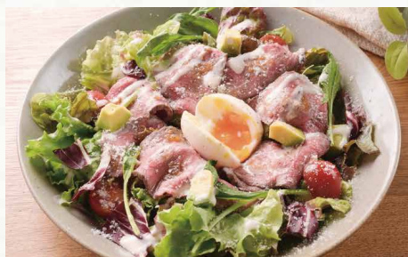
サロマ黒牛の ローストビーフサラダ