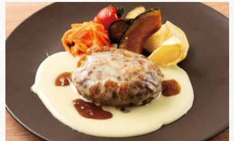
国産牛100%のフォンデュチーズ ハンバーグ