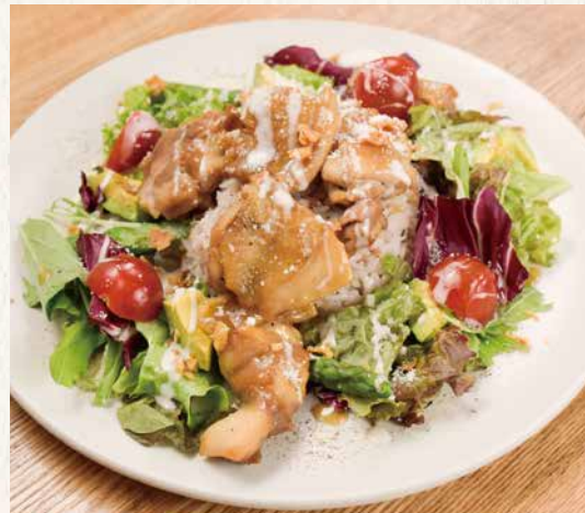
照り焼きチキンオーバーライス ¥1,480