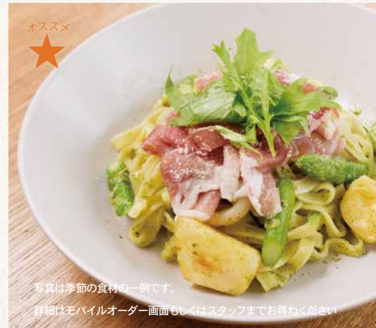
季節食材のジェノベーゼ