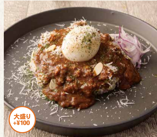
鶏ひき肉のキーマカレー ¥1,380