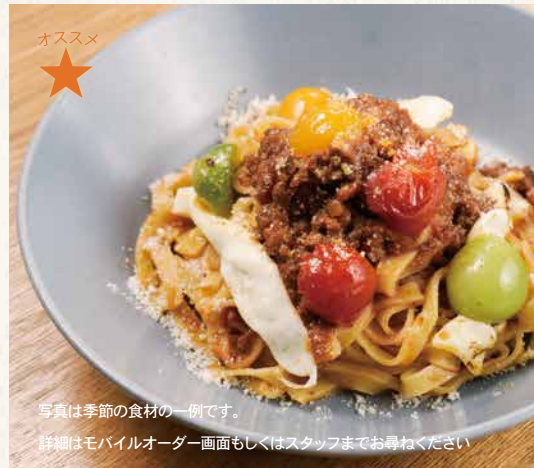
淡路牛のポロネーゼ ¥1,580