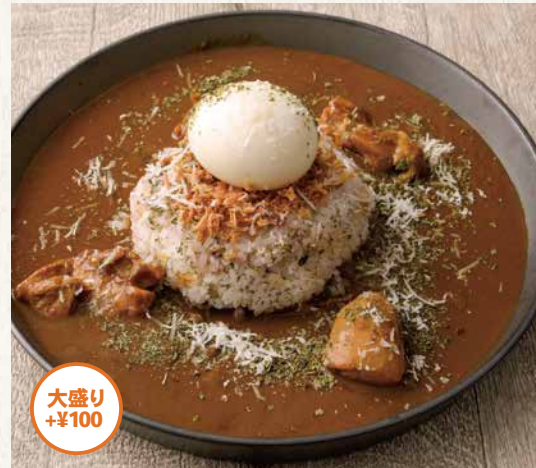
バターチキンカレー ¥1,380

TOPPING ゆで卵...¥150 からあげ2個...¥300 ハンバーグ...¥700