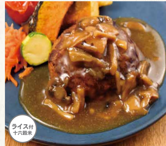
キノコと照り焼きソースのハンバーグ ¥1,680