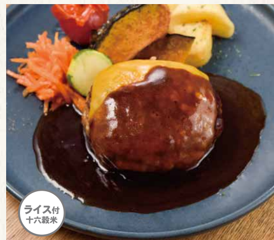
デミグラスソースとチェダーチーズのハンバーグ ¥1,680